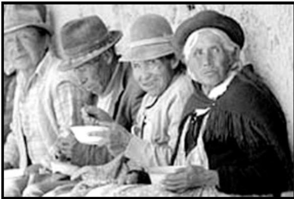
Niños y ancianos pobres se benefician de Juancito Pinto y Renta Dignidad, pero todavía son pobres

Pese a que las “nacionalizaciones” son limitadas, han posibilitado una serie de programas sociales que pretende mejorar la calidad de vida de la gente del campo y de las ciudades. En 2007 inició el programa Juancito Pinto que reparte 200 Bs. cada año a los niños en edad escolar de 1ro básico a 5to básico. En el 2008, comenzó la Renta Dignidad que asegura un bono anual de 2.400 Bs. a cada persona a partir de los 60 años. “Operación Milagro” ha utilizado la solidaridad de los doctores cubanos para realizar más de 250.000 cirugías de ojos de forma gratuita a los pobres. El programa de cedulación gratuita ya tiene 400.000 beneficiarios y el programa de alfabetismo, “Yo si puedo”, trabaja para erradicar el analfabetismo en el país.