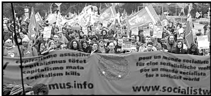
El CIT está luchando en todo el mundo. Únete a la lucha por una revolución socialista

Una revolución socialista en Bolivia serviría de guía a los movimientos sociales en toda Latinoamérica y el resto del mundo. Sin embargo, es necesario crear una organización socialista revolucionaria en un nivel internacional para aprovecharnos y aprender de la lucha en cada país y porque los capitalistas están organizados y nos atacan en un nivel internacional.