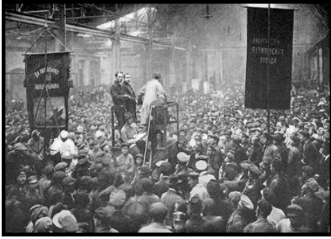
Los obreros y campesinos pobres hicieron la revolución rusa mediante los soviets

Sólo los movimientos sociales, con organización revolucionaria y conciencia socialista pueden movilizarse para acabar con la oposición derechista y resolver los problemas de extrema pobreza y desigualdad.