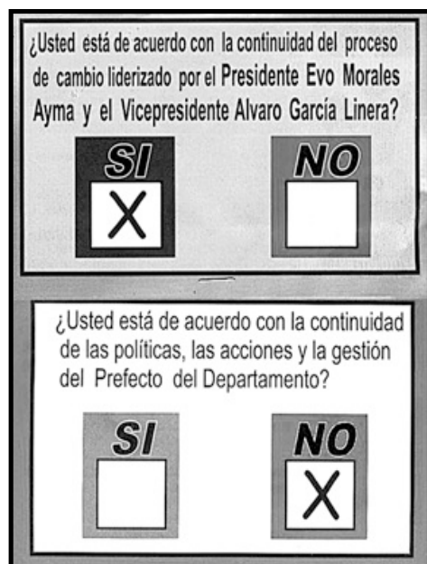
La pregunta exacta de la revocatoria. Vota Evo SI, Manfred No

El 10 de Agosto del 2008, el pueblo boliviano irá a votar en el referéndum revocatorio sobre el mandato del presidente y los prefectos del país. Las dos preguntas serán: 1) “¿Usted está de acuerdo con la continuidad del proceso de cambio liderizado por el Presidente Evo Morales Ayma y el vice-presidente Álvaro García?” y 2) “¿Usted está de acuerdo con la continuidad de las políticas, las acciones y la gestión del Prefecto del Departamento?”