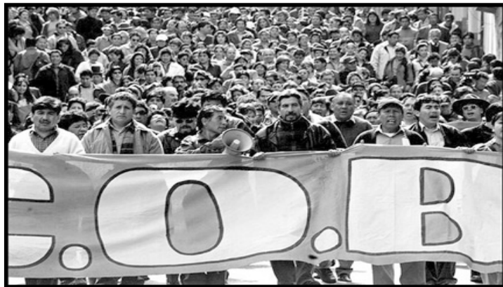
Nada puede detener el movimiento obrero y campesino cuando esta organizado y movilizado con conciencia y dirección socialista

La revolución boliviana necesitará una revolución socialista internacional para no quedar aislada. Aunque hoy no existen movimientos revolucionarios en cada país, es necesario entender que las revoluciones son contagiosas. Después de la revolución rusa hubo movimientos revolucionarios en muchos países, incluso en los países industrializados de Europa. También, la revolución cubana fue una chispa para una ola de revoluciones por todo el mundo, especialmente en Latinoamérica.