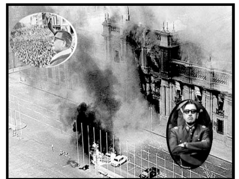
La revolución "democrática y pacífica" de Allende terminó en masacres, tortura y dictadura

Bolivia también tiene experiencia con la organización soviética, pero siempre de manera espontánea y efímera. En la revolución de 1952, fueron las organizaciones de trabajadores y campesinos, actuando en gran parte de forma independiente, que acabaron con la dictadura y permitieron el ascenso del gobierno de MNR. En la Guerra del Gas en 2003, las Federaciones de Juntas Vecinales dirigieron la lucha de forma democrática y ayudaron a formar la Agenda de Octubre planteando la nacionalización completa de los hidrocarburos bajo el control del pueblo y la creación de una Asamblea Constituyente Revolucionaria con representantes de los movimientos sociales. El carácter espontáneo y efímero del control popular sobre la lucha no quita la importancia de la victoria de la Guerra del Gas y, igual que Rusia en 1905, debe servir como una lección para crear organizaciones revolucionarias y movilizar a los campesinos, indígenas, obreros, pobres y jóvenes.