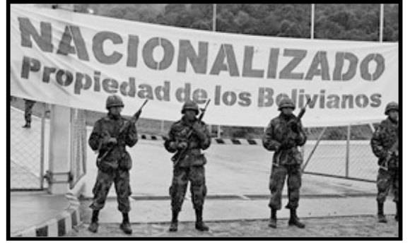
Gracias a la nacionalización, los hidrocarburos generan más de $2.000 millones cada año

Desde que asumió la presidencia, Evo Morales ha implementado un programa de reformas dirigidos a las grandes masas de campesinos, indígenas, trabajadores y pobres. Después de 25 años de gobiernos neoliberales, las reformas anti-neoliberales y anti-imperialistas de Evo y su retórica pro-socialista marcan un avance importante y necesario en el proceso revolucionario de Bolivia.