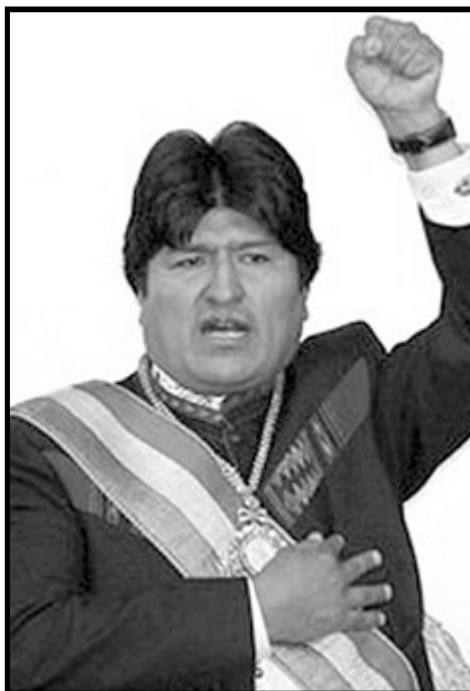
En Bolivia y el mundo, Morales es un símbolo de la lucha anti-neoliberal y anti-capitalista

Bolivia no fue ninguna excepción. En los años 80's y 90's prácticamente toda la industria boliviana—las minas, ferrocarriles, telecomunicaciones, y por supuesto, los hidrocarburos—fue vendida a las transnacionales por políticos corruptos con precios criminalmente bajos. Más de treinta mil mineros fueron re-localizados o despedidos de sus puestos de trabajo. Muchos mineros de Catavi, Siglo veinte y Llallagua, entre otros, migraron a las ciudades más pobladas de Bolivia, donde algunos se dedicaron al comercio informal. Asimismo el minifundio en la parte occidental de Bolivia ha provocado que cientos de miles de campesinos e indígenas abandonen sus comunidades y tierras para trasladarse a las ciudades; La Paz, Cochabamba y Santa Cruz, fueron los lugares escogidos por la mayoría, los emigrantes del área rural se establecieron en las periferias de las