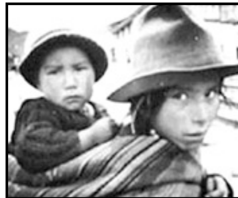
Reformas moderadas no pueden resolver los problemas de los obreros, campesinos e indígenas pobres

El programa de reforma agraria de Morales y el MAS es aún más moderado que el programa de nacionalización. Sólo pretende tomar la tierra ociosa o no productiva de los latifundios. La NCPE limitará al propietario a no más de 5.000 o 10.000 hectáreas pero esto todavía es latifundio. Además, el gobierno no ha movilizado a los campesinos e indígenas para realizar la reforma optando por cambios legales en vez de movilizaciones. Pero sin la fuerza de los movimientos sociales, el gobierno ni siquiera podrá realizar reformas moderadas. Los latifundistas han organizado sus propias milicias para atacar a los campesinos, dirigentes e incluso representantes del MAS utilizando armas de fuego. En Abril de este año en Alto Parapeto el Ministro de Hacienda y dirigentes campesino indígenas fueron atacados y disparados. Hubo decenas de heridos y desaparecidos.