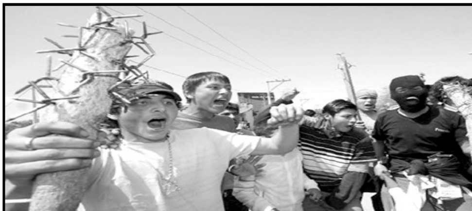
Sólo la fuerza de los movimientos sociales funciona para aplastar los fascistas de la oposición

La organización revolucionaria generalmente surge a raíz de las necesidades concretas de la lucha. Sin organización democrática, acción unida y conciencia revolucionaria es imposible acabar con la oposición derechista y terminar con la pobreza y desigualdad extrema. Los empresarios, latifundistas y transnacionales capitalistas de la derecha tienen varios ejes de poder. El poder político es uno que la derecha perdió parcialmente cuando Morales y el MAS fueron elegidos como gobernantes nacionales. Por otra parte, la derecha mantiene su control político mediante las prefecturas y gobiernos locales de varios departamentos.