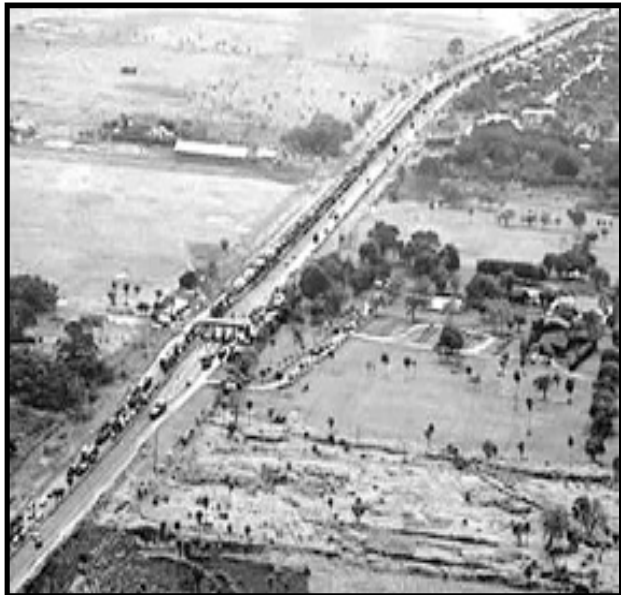
87% de la tierra cultivable en Bolivia está controlada por 7% de la población

Morales y el MAS también han iniciado una reforma agraria. Hasta ahora, el MAS ha “expropiado” más de 500.000 hectáreas de tierra no productivas de los grandes latifundistas y la ha distribuido a comunidades indígenas y a miles de campesinos pobres. Aunque criticamos los límites muy estrechos de la reforma, ASR apoya la redistribución de esta tierra como algo progresivo que justo ha empezado y que puede convertirse en una revolución agraria si las bases de los campesinos y comunidades indígenas se organizan y se movilizan con toda la fuerza que tienen.